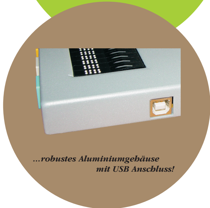
...robustes Aluminiumgehäuse mit USB Anschluss!

Durch den geringen Stromverbrauch (ca. 50mA) wird die MobilLine über den USB-Anschluss mit Strom versorgt, dies hat zum Vorteil das außer dem Anschlusskabel kein weiteres Zubehör wie Akkus oder Netzteil notwendig ist!